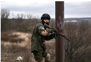
Un militaire ukrainien à Irpin, le 13 mars 2022.

En dépit des menaces explicites du pouvoir russe, nous opposons à cette éventualité un déni plus puissant encore que celui qui précédait le conflit, un déni dont je me demande s'il ne pourrait pas s'apparenter à ce que Freud a désigné sous le nom d'« illusion d'immortalité »: nous avons beau savoir consciemment que nous allons mourir, la mort n'est pas représentée dans notre inconscient et cela nous permet de vivre. Ne se joue-t-il pas là quelque chose de similaire? Nous savons, consciemment, que la porte du feu nucléaire est ouverte, mais nous ne pouvons considérer cela autrement que comme une hypothèse abstraite, sans conséquence sur notre vie quotidienne.