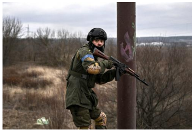
Un militaire ukrainien à Irpin, le 13 mars 2022.

PAR JOSEPH CONFAVREUX ARTICLE PUBLIÉ LE MARDI 15 MARS 2022